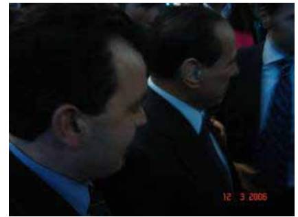
Silvio Berlusconi (Presidente del Consiglio)