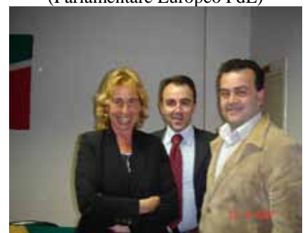
Stefania Craxi (Onorevole PdL)