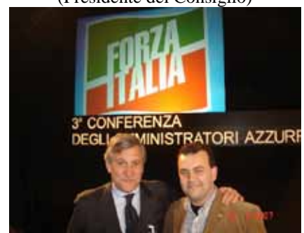
Antonio Tajani (Parlamentare Europeo PdL)